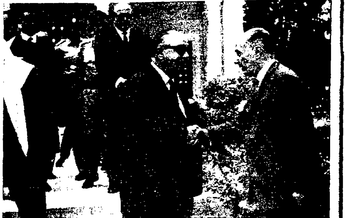
دولة السيد بيجت القنولي رئيس الوزراء يخدم العازي لسيد الشرف حسين بن ناصر رئيس الديوان الملكي بعد تسريح جثمان الاميرة عزة

وانتبت اس بهذا الرجل، وبعد حيث تغيرت قات له: - كندى نقيب نيا مرصع السناسور روبرت كندى وعلاقة ذلك بالعلقت؟ قال بعد ان انقضت القضية: كتبت الساعه ظهر الى القبية من صباح السادس من حزيران عندما تمسرت بغيروات تقيلة تصعد على درج عزلي، فنهضت من نومي، وسيمت بعد ذلك فرح الجرس، وكان صوت بخار قوية الطيبة «فايز مدي» يقول: اتضح يا ابو شريف... لا تخف... انا فايز فنهضت بلب القزل الذي كنت وحيدا فيه البتية على الصفحة الرابعة عمود ٦ صباح الخير... نعمه فقتك تتم باستعمال شفرات مجيد